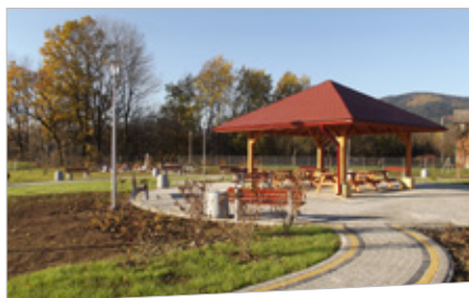
Z utworzonego parku rekreacyjnego będą mogli korzystać m.in. mieszkańcy DPS w Szczyrzycu.

rozgęszczenie mieszkańców; prawie 1180 m 2 pomieszczeń do rehabilitacji medycznej i terapii zajęciowej oraz prawie 3500 m 2 innych pomieszczeń. Nowopowstałe oraz zmodernizowane pomieszczenia zostaną odpowiednio wyposażone - zakupionych zostanie ponad 2050 sztuk nowego sprzętu lub wyposażenia. W pięciu projektach zrealizowano również działania mające na celu utworzenie parków rekreacyjnych lub modernizację otwartych przestrzeni na terenie placówek o łącznej powierzchni ponad 8100 m 2 . Te wszystkie działania przekładają się na wzrost komfortu i poziomu życia mieszkańców DPS, a także zmniejszają koszty eksploatacyjne w tych placówkach.